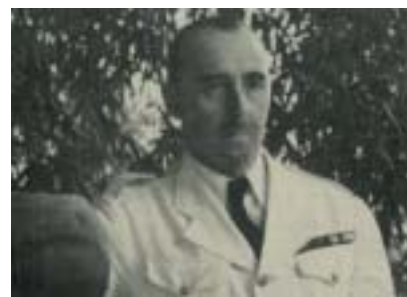
Le général de Larminat, commandant supérieur des Forces françaises libres en Afrique équatoriale française.

En Érythrée, février 1941, sous les ordres du colonel Monclar, 1 000 Français libres s'emparent de Cub-Cub, Keren et Massaoua, et font plus de 14 000 prisonniers. En juin 1941, ils participent à la bataille pour libérer la Syrie.