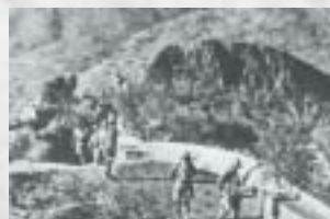
Les Français libres en Érythrée.