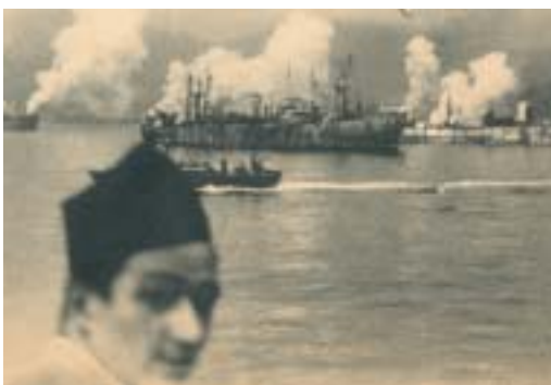
Débarquement le 16 août 1944 des troupes françaises commandées par le général de Lattre de Tassigny.

L'armée B débarque en Provence le 16 août 1944, après la conquête de la tête de pont par le 6 e corps d'armée américain. Sa mission est essentielle : elle doit s'emparer de Toulon et de Marseille, solidement défendues par les Allemands. Au Rayol, à Cavalaire, à Saint-Tropez, les Français prennent pied ; dans les