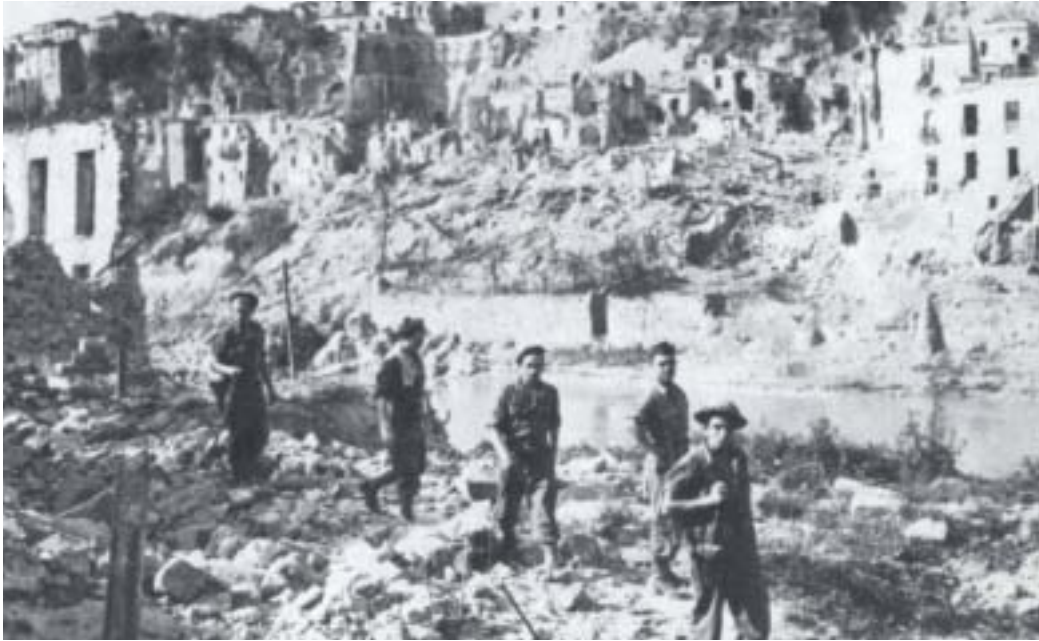
Elément de la 1 re DFL progressant dans les ruines de Pontecorvo (Italie).