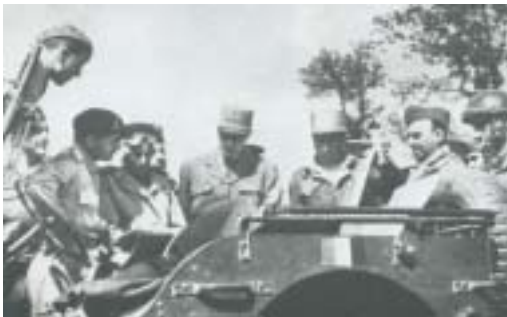
Le général Brosset, commandant de la 1 re DFL avec le général de Gaulle à San Ambrogio.

détachement d'armée A, commandé par le général Juin ; le détachement d'armée B, commandé par le général de Lattre de Tassigny.