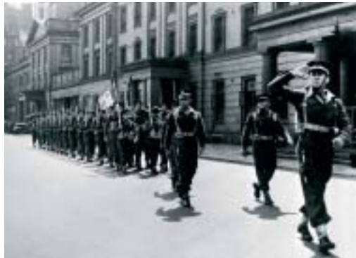
Un détachement de la marine défile à Londres.

En juin 1940, après la débâcle, l'Angleterre s'est retrouvée seule face à l'Allemagne et l'Italie. Or l'Angleterre est une île et tout (ou pratiquement tout) ce dont elle a besoin vient par mer, par