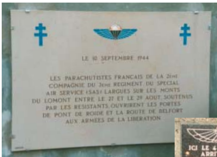
Plaque apposée à Pont-de-Roide (Doubs) en souvenir de la mission des sticks SAS de Sicaud et Tupet-Thomé.

Dans le Finistère les sticks du capitaine Sicaud et du lieutenant Tupet-Thomé vont porter main-forte aux hommes de Bourgoin et mission accomplie, ils seront peu après à nouveau parachutés dans le Doubs.