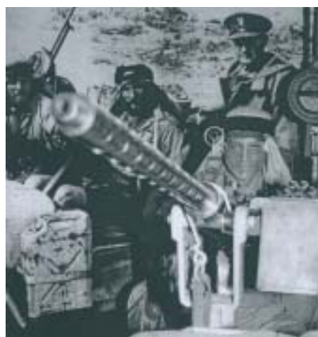
Musée de Saint-Marcel (Morbihan) partie réservée aux SAS.