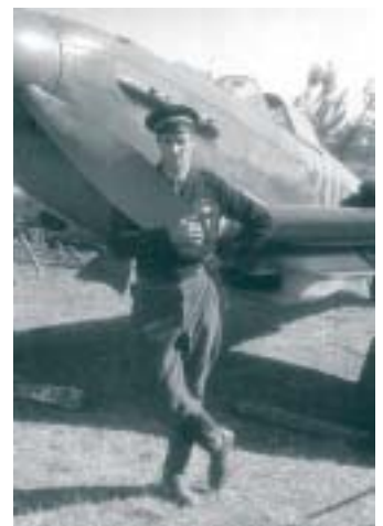
Jeune aviateur ayant rejoint les Forces françaises libres.