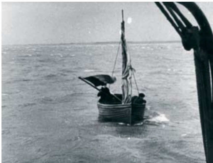
Deux jeunes Français abordent la côte anglaise pour s'engager.