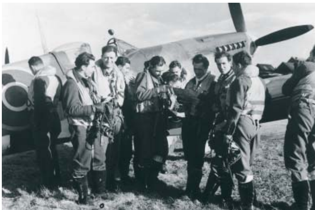
Pilotes auprès de leurs appareils attendant le départ en mission.