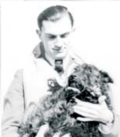
Commandant René Mouchotte, né le 21 août 1914 à Saint-Mandé (Val-de-Marne) et la mascotte de l'escadrille.