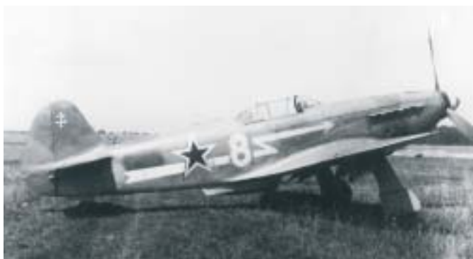
Yak 3 du groupe « Normandie ».