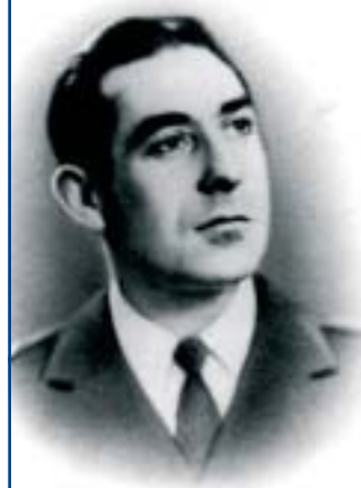
Henri Bouquillard, né le 14 juin 1908 à Nevers (Nièvre).

À la fin de ses études au lycée de Nevers, Henry Bouquillard devance l'appel et effectue son service militaire au 13 e bataillon de chasseurs alpins, puis se rengage jusqu'en 1932 au titre du 35 e régiment d'infanterie. Passionné par l'aviation, il obtient son transfert dans l'armée de l'air au titre de la réserve. Rappelé à l'activité le 2 septembre 1939, il est dirigé le 10 mai 1940 sur le bataillon de l'air 108 de Montpellier. Le 25 mai 1940, il rejoint comme moniteur l'École de pilotage de Marrakech. Dès les premières rumeurs de la signature d'un armistice, le sergent Henri Bouquillard, très affecté par la défaite de la France, alors qu'il ne s'est pas battu, décide de rallier la Grande-Bretagne. Il se rend à Casablanca pour y chercher un embarquement. Il réussit à embarquer clandestinement sur le cargo Oak Crest , affrété par le gouvernement britannique pour évacuer des troupes polonaises vers la Grande-Bretagne. Le 30 juillet, Henri Bouquillard rejoint la School of Army Cooperation . Il sera le premier pilote des FAFL tué en combat aérien le 11 mars 1941.