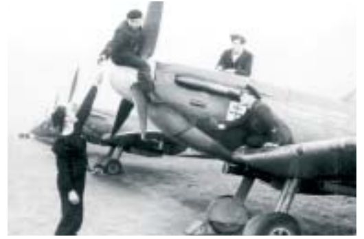
Les « Spitfire » du groupe « Île-de-France ».

ennemis et est la première unité Française Libre à être faite Compagnon de la Libération. Dans le même temps, des unités FAFL (« Menace » et « Topic ») quittent l'Angleterre fin 1940 : après avoir échoué dans leur tentative de ralliement de Dakar, elles remontent vers le Moyen-Orient en appuyant la colonne du général Leclerc, notamment dans la prise de Koufra.