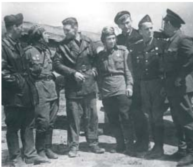
Aviateurs français et soviétiques sympathisant sur le front russe.

En septembre 1942, pour des raisons sans doute plus politiques que militaires, le général de Gaulle décide la création et l'envoi en Russie d'un groupe