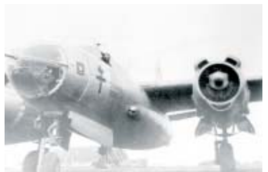
B-26 « Marauder » du groupe « Bretagne ».