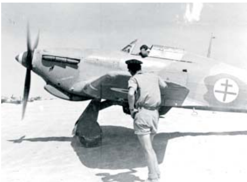
Hawker « Hurricane » du groupe « Alsace » en Lybie.