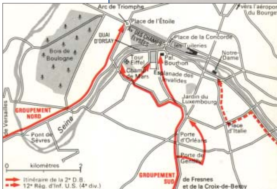
Entrée dans Paris de la 2 e DB et de l'infanterie US.