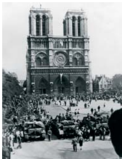
Les chars de Leclerc sur le parvis de Notre-Dame.