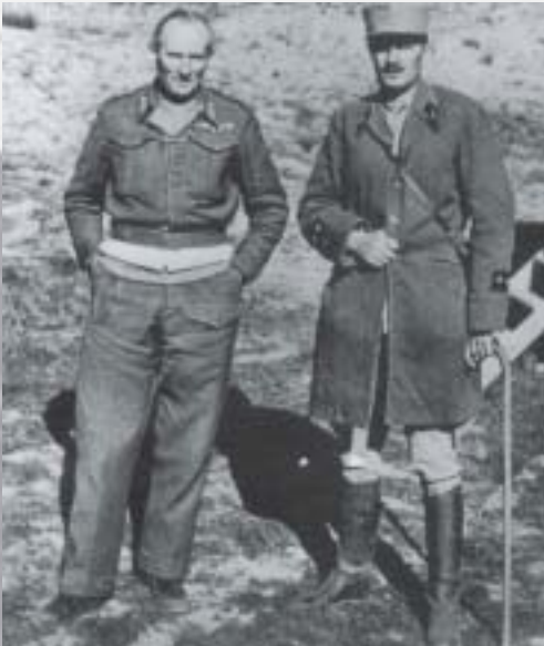
Les généraux Montgomery et Leclerc.

peut être, selon les instructions de de Gaulle, immédiatement mise à contribution dans la campagne de Tunisie. C'est pourtant le BIMP qui entrera le premier en Tunisie, en prenant position autour du terrain d'aviation de Medenine, le 23 février. La colonne Leclerc ne s'installera à Ksar Rhilane que quelques jours plus tard.