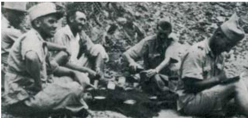
Des éléments de la colonne Leclerc en direction de Koufra.

Le 2 décembre 1940, Leclerc est promu commandant militaire du Tchad et chargé de préparer l'opération contre le Fezzan et, pour commencer, contre l'oasis fortifiée de Koufra (Sud-Est de la Libye, près de la frontière égyptienne). À Fort-Lamy, il retrouve ses compagnons du Cameroun (Jean Colonna d'Ornano, Jacques Massu, Jacques de Guillebon) ; il prend également le commandement du régiment des tirailleurs sénégalais du Tchad, auquel il va amalgamer d'autres unités provenant du Congo, de l'Oubangui-Chari et du Gabon – en tout quelque 6 000 hommes, dont 500 Européens, qui vont constituer sa « colonne saharienne ».