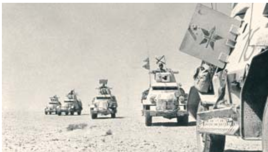
La colonne Leclerc qui s'élance à la conquête du Fezzan.