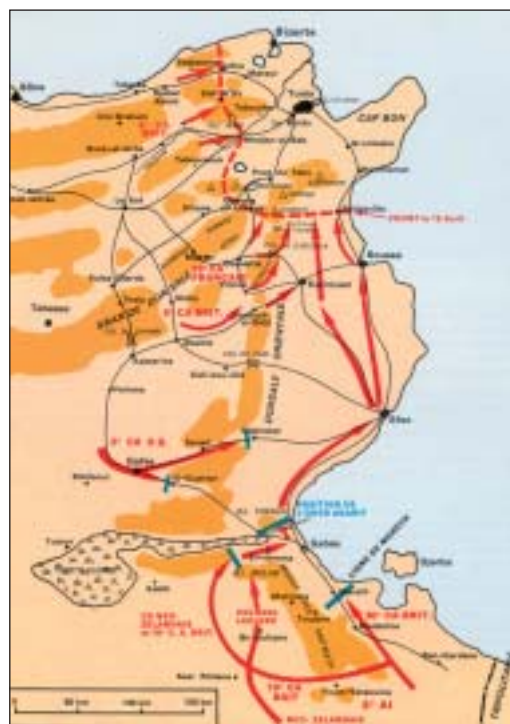
Itinéraire de la colonne Leclerc en Tunisie

Rommel, partisan d'évacuer la Tunisie, est remplacé par le général von Arnim, mais celui-ci ne parvient pas à renverser le cours des événements. Le 20 mars, Montgomery passe à l'offensive sur la ligne Mareth ; il se heurte à une vive opposition ennemie, qui l'oblige à une manœuvre de débordement, appuyée par plusieurs groupements de la Force L. Huit jours plus tard, la prise de Gabès par Leclerc obligera les Allemands à décrocher et permettra aux Américains du général Patton de reprendre Gafsa. Le 2 avril, Leclerc rencontre Giraud à Gabès : il tente vainement