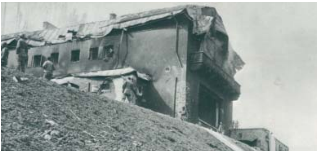
Le «nid d'Aigle» d'Hitler détruit.

Après avoir joué un rôle actif dans la libération de Royan (14-18 avril 1945), la 2 e DB, rattachée à la 7 e armée américaine du général Patch, est enfin envoyée en Allemagne. Regroupée en Bavière au début de mai, elle entreprend sa dernière charge vers le « Nid d'Aigle » de Hitler à Berchtesgaden, qu'elle occupe à la veille de la capitulation allemande. La « division Leclerc » quittera l'Allemagne le 23 mai pour Fontainebleau, où, après avoir descendu les Champs-Élysées à bord de son char le 18 juin 1945, Leclerc passera son commandement à son fidèle adjoint, le colonel Dio : « Quand vous sentirez votre énergie fléchir, dira-t-il alors à ses hommes, rappelez-vous Koufra, Alençon, Paris, Strasbourg. Retrouvez vos camarades, recherchez vos chefs et continuez, en répandant dans le pays le patriotisme qui a fait notre force. » ■