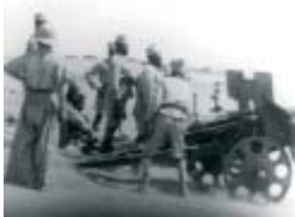
Artilleurs de la colonne Leclerc.

Après avoir abandonné le commandement des troupes de l'Afrique française libre au général Marchand, Leclerc rencontre à Ghadamès le général Delay, commandant le front est-saharien du Sud algérien : c'est la première liaison des FFL et de l'armée d'Afrique (2 février 1943). Dix jours plus tard, la « colonne Leclerc » devient « Force L » (comme Leclerc) dans le cadre de la 8 e armée britannique.