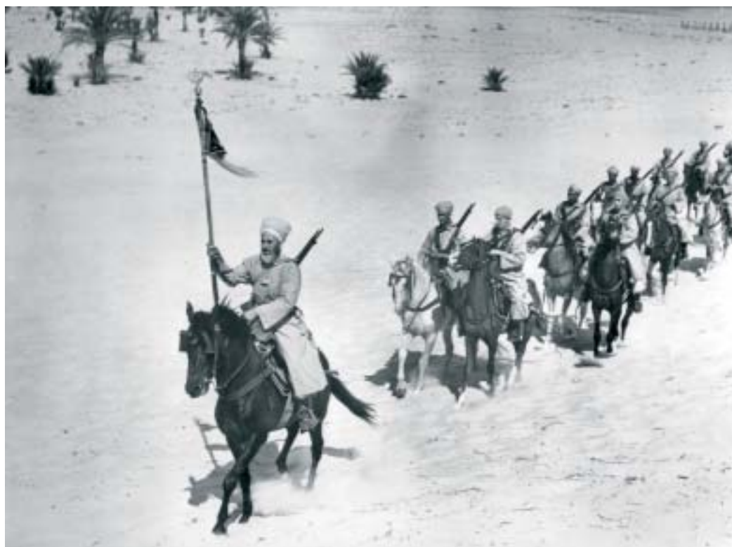
Un détachement de spahis marocains dans le désert.