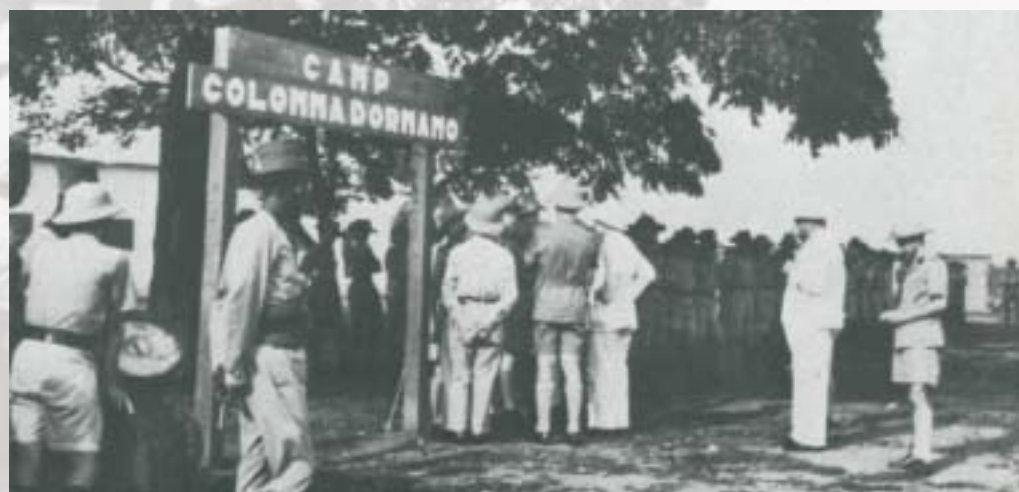
Camp Colonna d'Ornano à Brazzaville.