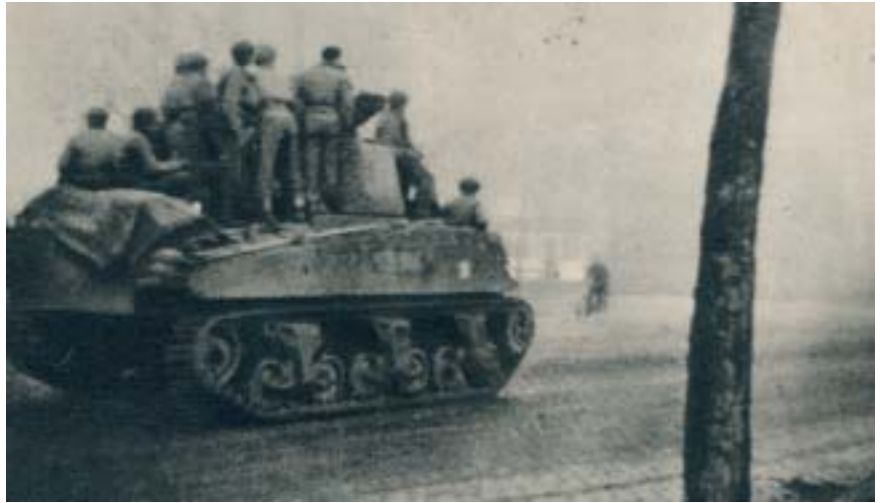
Chars de Leclerc en patrouille en Alsace.

Au début de septembre, avec l'accord d'Eisenhower, de Gaulle décide d'envoyer la 2 e DB vers Strasbourg.