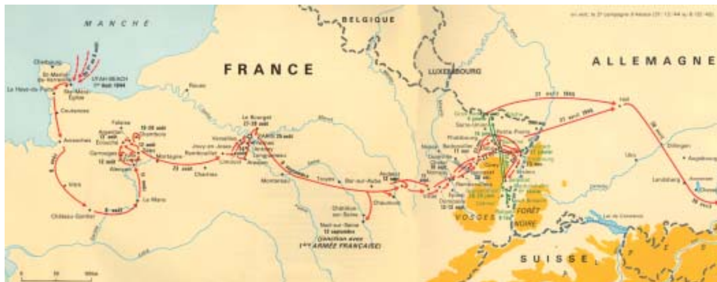
Parcours de la 2 e DB de la Normandie jusqu'en Allemagne.