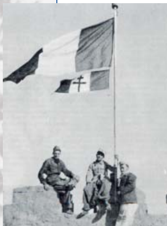
Le drapeau tricolore et la flamme à la croix de Lorraine hissé sur le fort de Koufra.