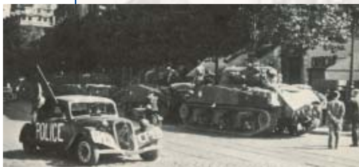
Libération de Paris : chars de Leclerc et voiture FFI.

vers Rambouillet (21 août) : cette avant-garde n'entrera dans Paris – où l'insurrection populaire est en marche – que si l'ennemi s'en retire.